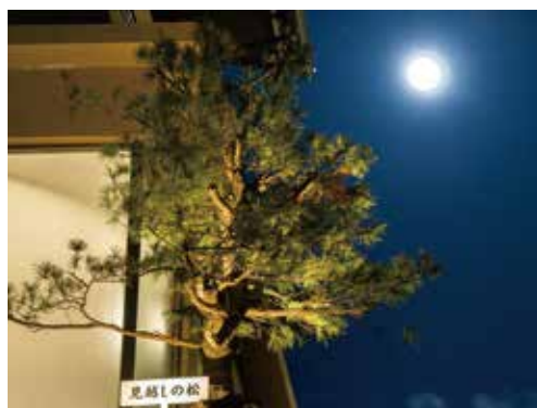
「見越しの松」が皆様をお待ちいたしております。