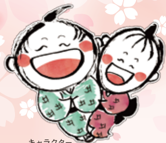
キャラクター ゴローさん&みさ子さん