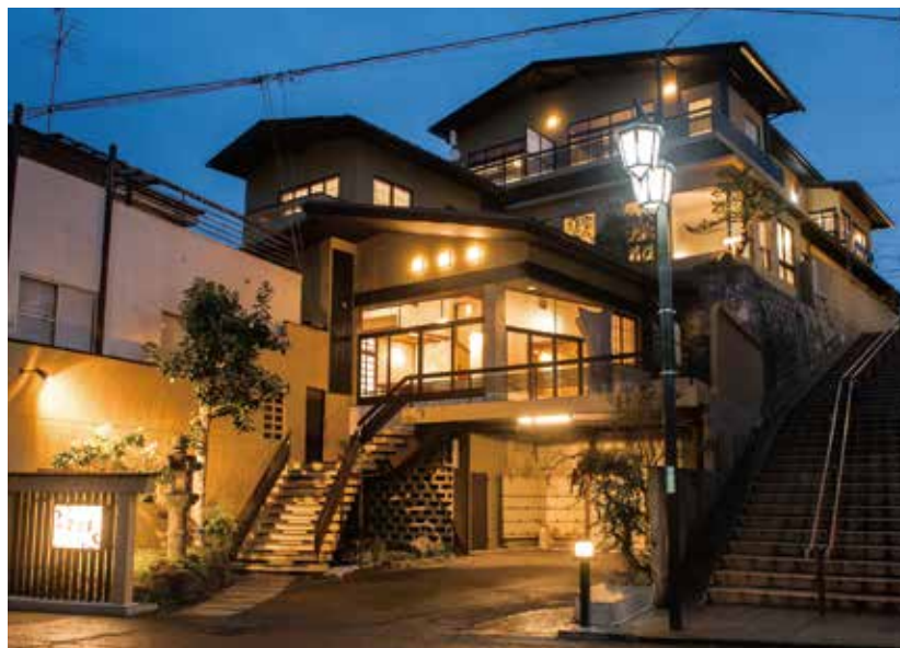
宿あたご屋にはエレベーターはありません。階段が似合う懐かし昭和の宿です。