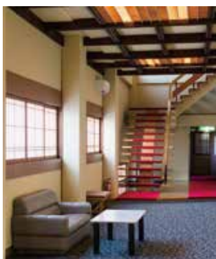
2階から3階へも階段での移動となります。