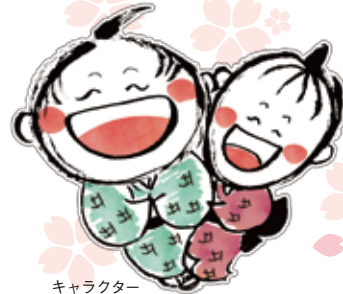
キャラクター ゴローさん&みさ子さん

不動の嚴運 宿・あたご屋 動じず作ろわす ありのまま お客様好みの 老酒の 宿です